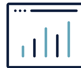
Tableau coloca los datos y el análisis en el centro de la toma de decisiones. Esto ayuda a que toda la organización funcione de manera más eficiente.